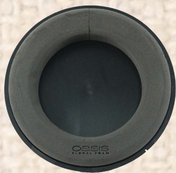
OASIS ® BLACK NAYLORBASE ® Design Ring